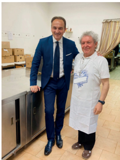
Il presidente della regione Piemonte Alberto Cirio in visita alla mensa

Dal 30 Agosto ho iniziato ad andare, compatibilmente con le altre mie esigenze "vitali". Conoscevo la Mensa di via Belfiore 12 per avervi prestato servizio, in vari turni, nel 2014-2017; ma adesso molto è cambiato, a causa del Covid i Poveri non siedono più ai tavoli all' interno, come fino al 2020. Il servizio normale (al quale partecipo), dal lunedì al venerdì, consiste nel preparare circa 200 sacchetti giornalieri con un pranzo da asporto; al sabato, gruppi di volontari preparano pacchi per le famiglie, alla Domenica i sacchetti sono consegnati al mattino. Rividi veterani "immortali", sia tra i volontari che tra i Poveri beneficiati; e vidi molti volti per me nuovi. Storie personali, visione del mondo, caratteri diversi: ovvio che, sul piano umano, non tutto è come vorremmo noi, non tutti ci sono simpatici; ma tutti i volontari (ed anche i "professionisti", come il sacerdote "onnipresente"